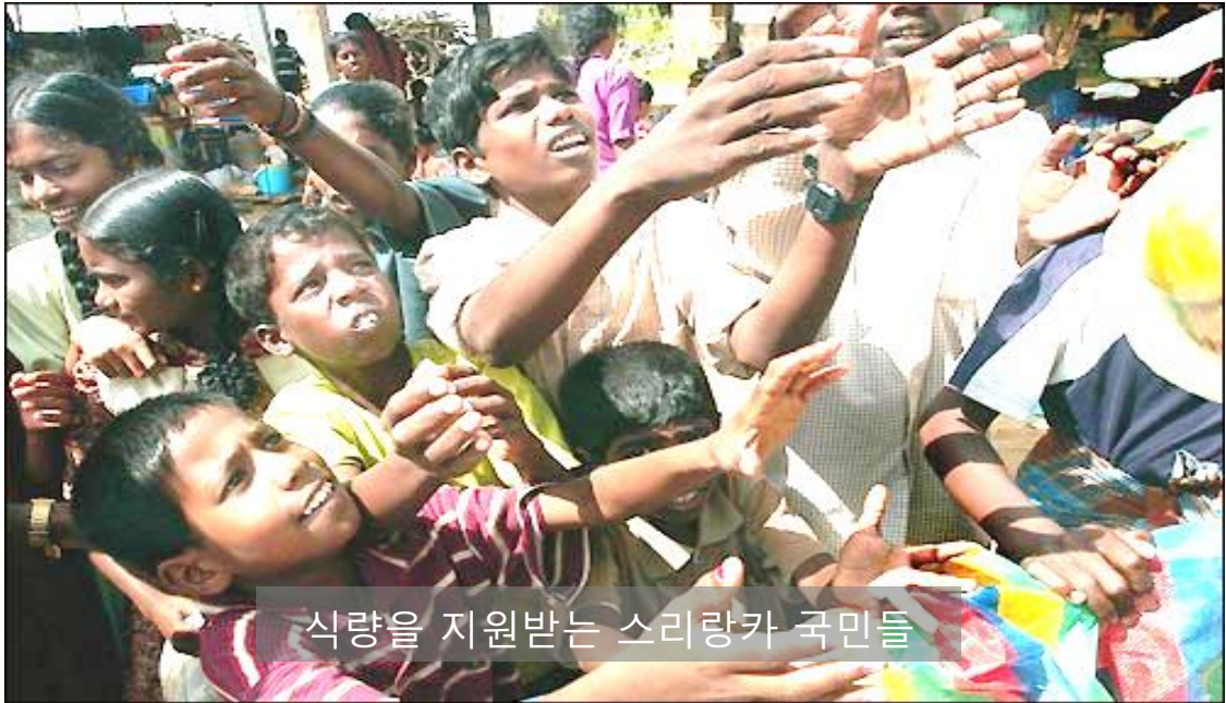
식량을 지원받는 스리랑카 국민들

세계식량기구에 의하면, 스리랑카 식량가격이 90%이상 상승하여, 4명중 한 명은 끼니를 거르는 것으로 나타났습니다. “사람들이 하루 끼니를 줄이고 있으며, 음식의 양을 점점 줄이고 있습니다. 점점 식사습관이 변화되어가고 있습니다” (Manoj Thibbotuwawa, 경제학자)